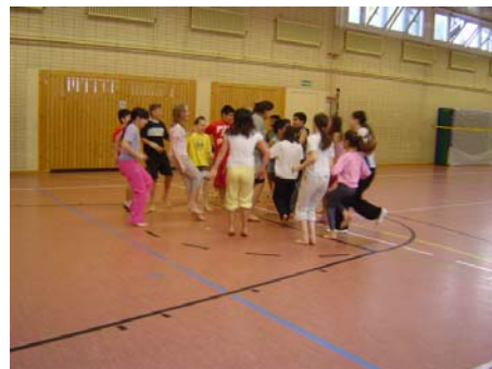
Tanzprojekt an der Hermann-Boddin-Schule

Im Jahr 2006 stehen dem Aktionsfonds Flughafenstraße 10.000 Euro für kleinteilige Aktivitäten zur Verfügung, über deren Verwendung eine Bewohnerjury entscheidet. In der ersten Jahreshälfte wurden bereits 12 Projekte gefördert, vorrangig aus dem Bereich Kinder- und Jugendarbeit sowie Stadtteilkultur. Zum Stand 30. Juni 2006 stehen noch 4.430,20 Euro für Aktionen von Bewohnern, Gewerbetreibenden und Einrichtungen im Stadtteil zur Verfügung.