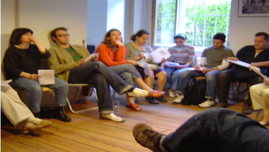
Vorbereitende Quartiersbeiratssitzung im Quartiersbüro Erlanger Straße 13

Am 20. Juni 2006 war es soweit. In der konstituierenden Sitzung des Quartiersbeirates Flughafenstraße wurden sowohl die Mitglieder als auch die Geschäftsordnung dieses Mitentscheidungsorgans für den Stadtteil bestimmt. Bis zur nächsten Sitzung sind alle interessierten Bewohner, Gewerbetreibenden und Einrichtungen aufgefordert, ihre Ideen für einen lebenswerten Stadtteil Flughafenstraße im Quartiersbüro in der Erlanger Str. 13 einzureichen. Annahmeschluss ist Freitag, der 8. September 2006 um 12.00 Uhr . Weitere Informationen zum Quartiersbeirat und den Handlungsschwerpunkten, für die Ideen aus der Nachbarschaft gesucht werden, finden sich im Schaufenster des Quartiersbüros Erlanger Str. 13 oder auf der Internetseite www.qm-flughafenstrasse.de