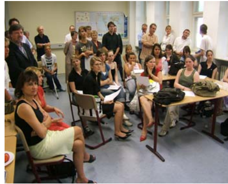
Ergebnisbekanntgabe der Abi-Prüfungen