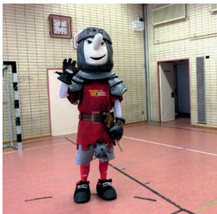
Ritter Keule, Maskottchen von FC Union

Auf die Partnerschaft mit dem Berliner Fußballverein ist die „Grundschule für Bewegung und Kommunikation“ in der Boddinstraße schon ein wenig stolz. Im Rahmen des Projekts „Union macht Schule“ kommt ein Trainer dreimal pro Woche in die Boddinschule. Er hat eine Pausenliga aufgebaut und bietet neben klassischem Fußball auch Trendsportarten wie Flagfootball und Spikeball an, zum Teil als